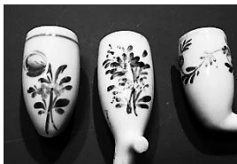
Afb. 18. Drie kleine koppen beschilderd met bloemen.