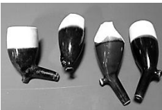
Afb. 20. Vier koppen in bruin/wit met hiel.