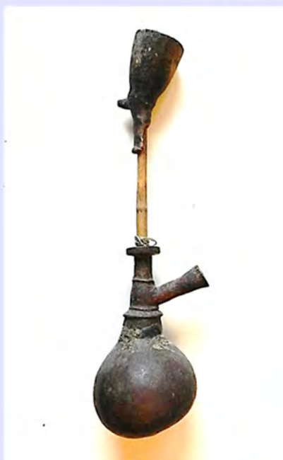
Een waterpijp met een hielkje uit Thailand (zie pagina 15).