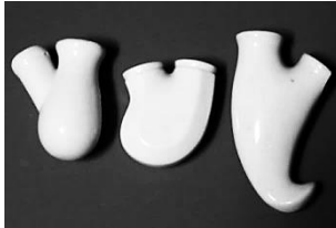
Afb. 12. Drie cilindrische waterzakken van wit porselein.