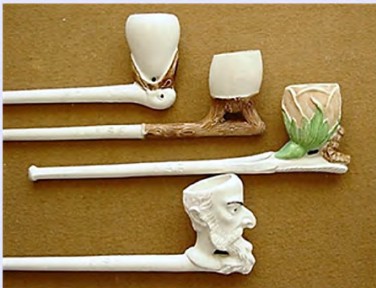
Een groep Taxile-pijpen uit de verzameling van Mimerel (zie pagina 17)