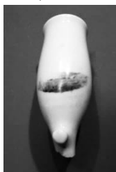
Afb. 10. Slanke pijp versierd met simpele, paarse penseelstreken.