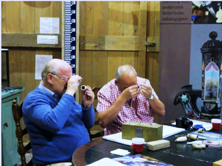
De PKN-experts aan het werk tijdens de druk bezochte determinatiedag in Middenbeemster (zie pagina 5)