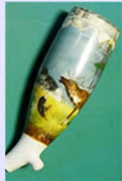
Jachtaferelen op porseleinen pijpekoppen (pagina 6)