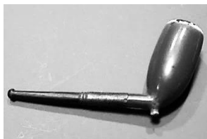
Afb. 23. Bruine eivormige kop met hiel aan mondstuk.

Bovendien waren in de 19 e eeuw deze porseleinen pijpenkoppen verkrijgbaar in kobaltblauw. (afb. 22) Deze pijpenkoppen hebben vaak een dikke koollaag. Er werd dus intensief uit gerookt! Die groep kleine porseleinen pijpenkoppen, wordt zonder een porseleinen waterzak in een mondstuk gestoken.