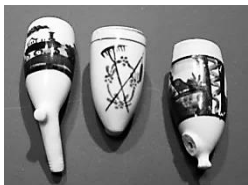
Afb. 17. Drie kleine koppen met een treintje, een dorsvleugel en hark en een boerderij.