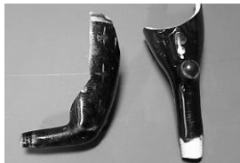
Afb. 14. Twee groen geglazuurde waterzakken.