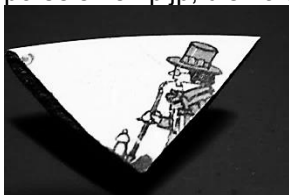
Afb. 16. Kleine scherf waarop roker met lange porseleinen pijp. Akkervondst Groenekan, tweede helft 19 e eeuw.

Hildebrand gooide er in zijn 'Camera Obscura' (1839), nog een schepje bovenop. Over roken uit een porseleinen pijp in de diligence schreef hij: 'Geen reine, blanke Goudse pijpen meer met een voorzichtig dopje gewapend; maar een lelijk, slangachtig, stinkend, pruttelend, door en door van vuiligheid doortrokken moffentuig.'(9) Op een aardewerk scherf uit een schotelrand, van slechts 2,5 cm hoog, zien we een roker met hoge hoed en porseleinen pijp, die zo uit diligence gestapt kan zijn.(10) ( afb. 16)